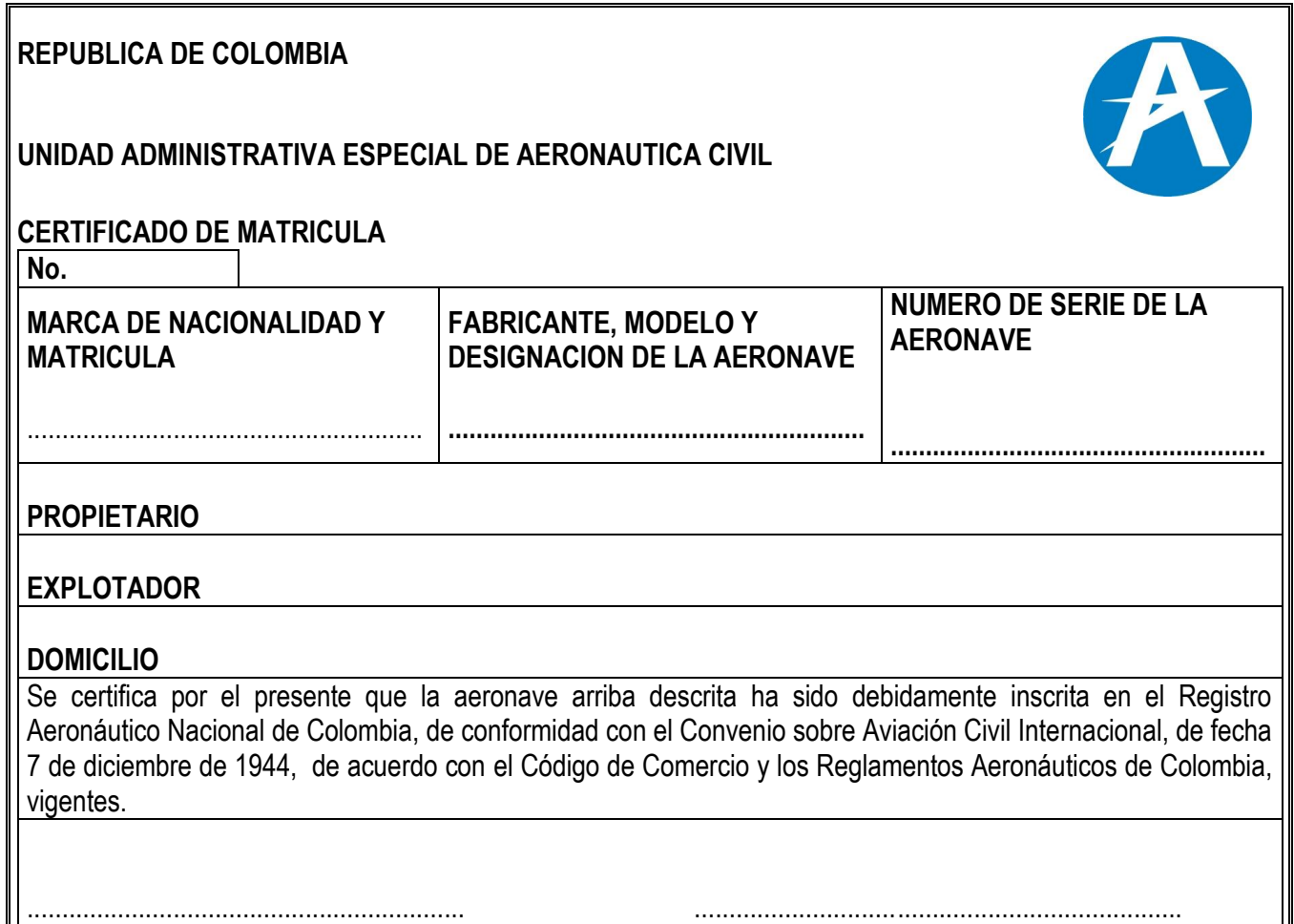
Figura 1. Certificado de Matrícula